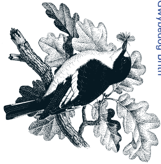
Pied Flycatcher Gwybedog Brith

A wide variety of birds nest on the reserves, making use of the many nest sites available in the large mature trees and dense shrubby areas. Nest boxes provide homes for even more. Fifty four bird species have been recorded since the land became nature reserves in the 1970s. How many can you spot? Common breeding species include Pied Flycatcher, Willow Warbler, Great Spotted Woodpecker, Treecreeper and Nuthatch. In the autumn, when the leaves fall from the trees, look up through the branches to spot soaring Buzzard, Red Kite and large numbers of Ravens in the sky above. Woodcock use the site in winter.