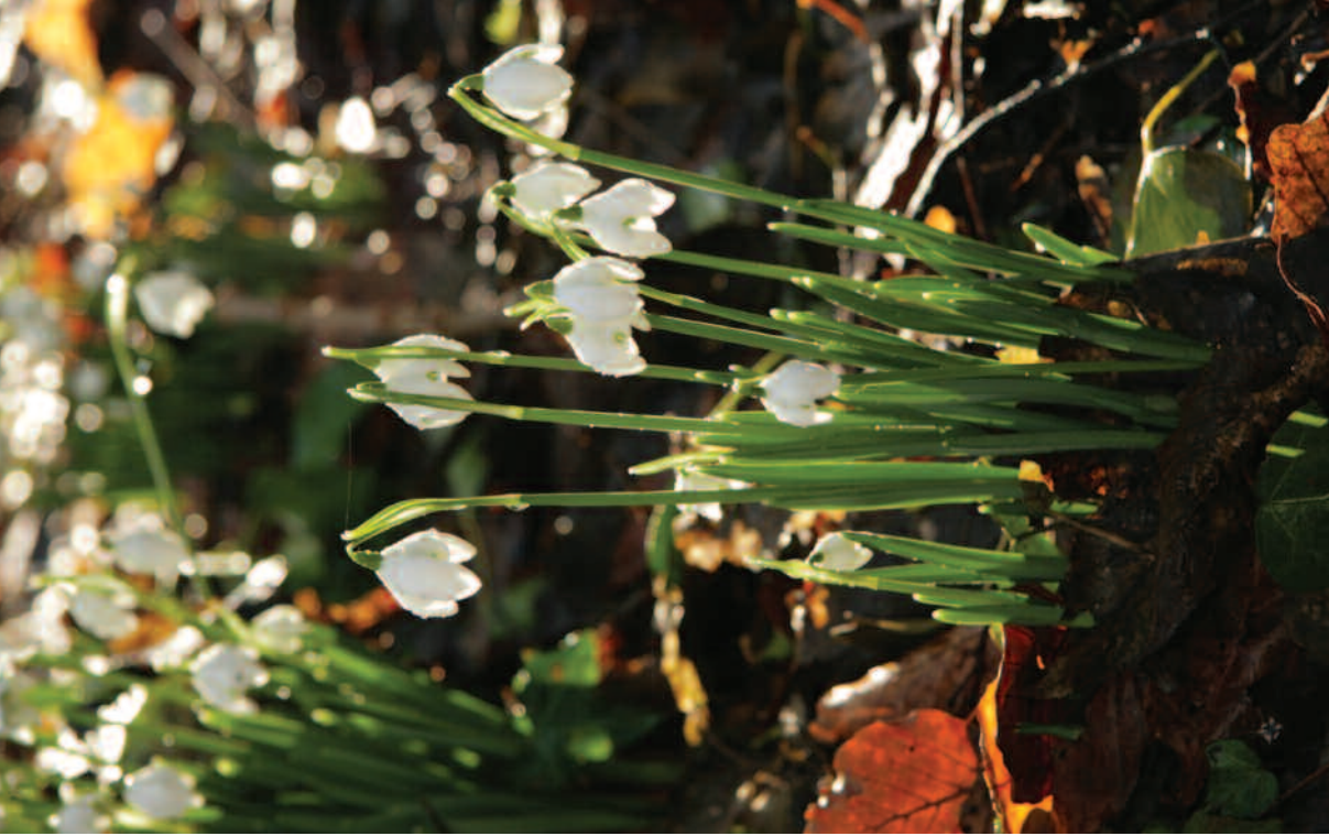
Produced by Fitzpatrick Woolmer Design - 01634 711 771