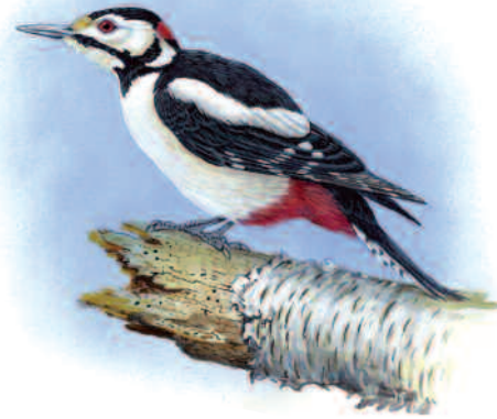
Great Spotted Woodpecker Cnocell Fraith Fwyaf