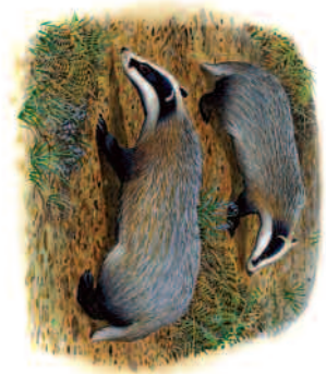
Badger Mochlyn Daear

Mae Hen Fryn Cwninger a Choed Penglanowen yn goetiroedd aeddfed ac yn 'lled-naturiol', sy'n golygu nad ydynt erioed wedi cael eu planu. Fodd bynnag, arferai'r ddwy goetir fod yn rhan o stad anterth yn perthyn i Blasty Nanteos, a cheir peth tystiolaeth o'r rheolaeth arnynt yn y gorfannol ar ffurf y rhywogaethau anffodorol sy'n bresennol. Cadwch lygad am ffocâu plws y Rhododendron, yn arbennig yng Nghoed Penglanowen, a choed anffodorol fel Castanwydd Melys a phlanhigion eraill a gyflwynwyd, fel y llwyni Cyrains sy'n gorchuddio'r llawr mewn rhannau o Hen Fryn Cwninger.