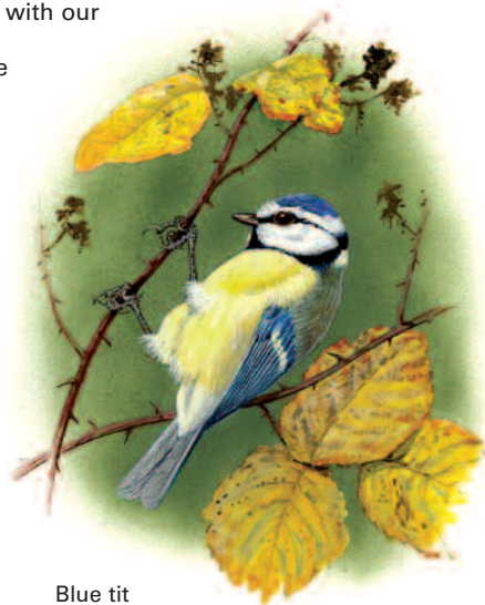
Blue tit Titw Tomos Las

Ewch i'r warchodfa ym mis Mai i weld y carped trawiadol o Glychau'r Gog yn y ddwy warchodfa. Mae'r rhywogaeth brodorol hwn yn gwyro mwy ac yn llai na Chlychau'r Gog Sbaen, sy'n flodau cryfach ac i'w gweld yn aml mewn gerddi. Mae Clychau'r Gog Sbaen yn gallu ffurfio hybrid gyda'r rhywogaeth brodorol ac felly maent yn fygythiad i'n coetiroedd brodorol o glychau'r gog.