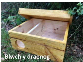
Blwch y draenog