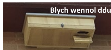
Blych wennol ddu